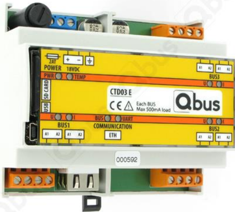
Afbeelding 1: Controller CTD03E