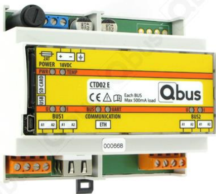
Afbeelding 1: Controller CTD02E