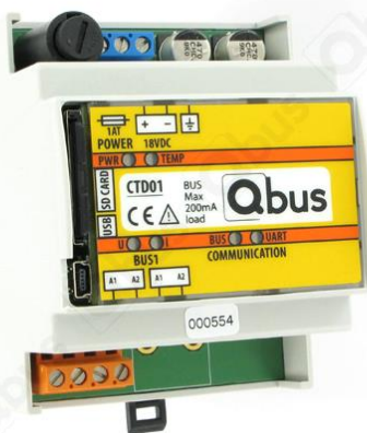
Afbeelding 1: Controller CTD01

Een Qbus-controller is alleen beperkt op het vlak van de stroom die hij via de bus kan leveren – in geval van de CTD01 is dit 250 mA, wat betekent dat op de bus ongeveer 15-20 modules kunnen worden aangesloten. Naast de stroombeperking kan een Qbus-controller maximaal 388 beschikbare adressen sturen. Verschillende soorten uitgangen gebruiken een verschillend aantal adressen, bijvoorbeeld: