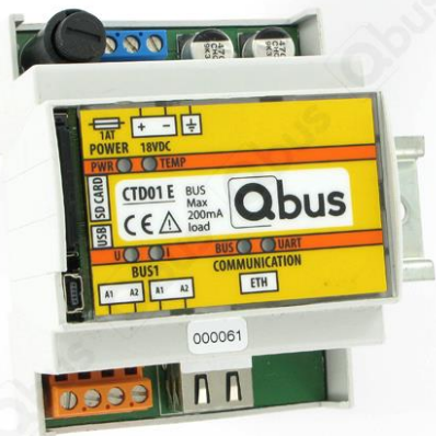
Afbeelding 1: Controller CTD01E