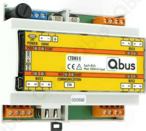
Figure 1 : contrôleur CTD03E