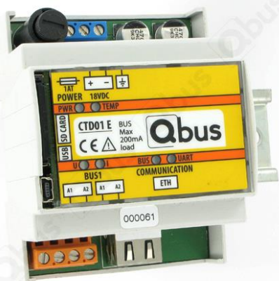
Figure 1 : contrôleur CTD01E