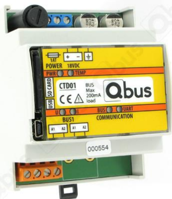
Figure 1 : contrôleur CTD01

Un contrôleur Qbus est uniquement limité par la puissance qu'il peut fournir via le bus – dans le cas du CTD01, il s'agit de 250 mA, ce qui permet de connecter environ 15-20 modules sur le bus. À part cette limite de puissance, un contrôleur Qbus peut contrôler jusqu'à 388 adresses disponibles. En fonction de la sortie, une sortie utilise une ou plusieurs adresses, par exemple: