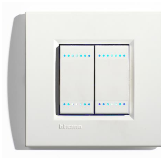
1 Bticino® SWC04/N LIGHT