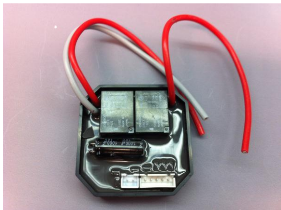
Figure 1 : module volet ROL01