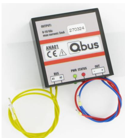
Figure 1 : Module de variateur analogique décentralisé. ANA01